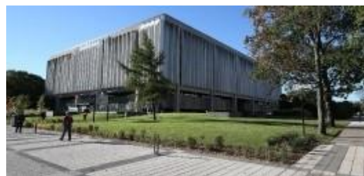
Bibliothèque de l'Université Laval – Pavillon Jean-Charles-Bonenfant.

De là, tout est possible. On embauche du personnel, on crée des postes qui n'existent pas encore (comme celui des conseillers à la documentation) et on amorce l'automatisation des services de la bibliothèque. Les premiers services à avoir été automatisés sont le RVM et l'acquisition des périodiques. La bibliothèque avait tenté l'implantation du prêt automatisé à la bibliothèque des sciences en 1967, mais ce fut un fiasco. En revanche, c'est un succès en 1969. Bien que très bruyant, ce système de cartes perforées reste en fonction jusqu'en 1977, quand il est remplacé par le prêt informatisé. Les services suivants à être automatisés sont le Service des acquisitions et, en tout dernier, le Service du catalogage.