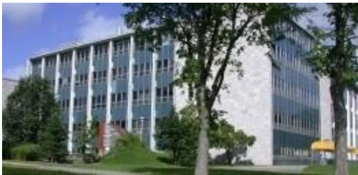
Bibliothèque de l'Université Laval – Alexandre-Vachon.

Cette période n'est pas que tourmente, mais également innovation par le développement d'une offre de formation documentaire systématique, par le développement d'un service de téléréférence (utilisation des bases de données) et par sa participation à un projet de télécatalogage (collaboration inter-universitaire pour le catalogage).